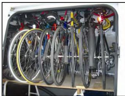
17 cykler pakket på 3.20 m

Efter at have drukket eftermiddagskaffe blev nogle enige om at tage en cykeltur til Børge med flere planlagde hurtigt en rute på kortet og efter at