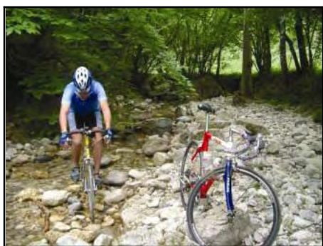
På afveje alligevel...

bremserne blev varme og nægtede at fungere, så han måtte ud at bremse i en skrænt- dog uden at komme til skade. Endelig nede ved asfalten var der en dejlig lang nedkørsel hvor vejen passerede nogle store stenbrud med meget tung trafik, bilerne havde ødelagt asfalten og det krævede meget koncentration – men stærkt gik det.